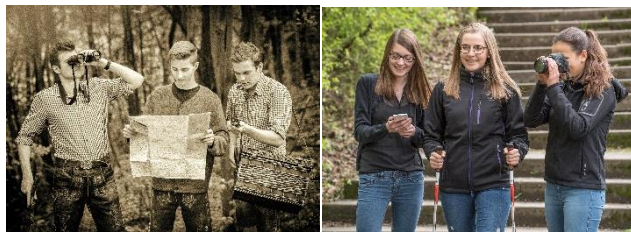
Seminarteilnehmer bei der Arbeit

Die einzelnen Beiträge folgen dabei alle demselben Aufbau: Um sich einen ersten Überblick verschaffen zu können, geben Symbole die Eignung beziehungsweise Besonderheiten der jeweiligen Strecke an. So erfährt man, ob die Route für Radfahrer, Wanderer, Familien mit Kindern oder Kinderwagen geeignet ist und eine Anbindung an öffentliche Verkehrsmittel besteht. Zudem erhält man in Form von Stichpunkten folgende Basisinformationen zu den jeweiligen Touren: Strecken- oder Rundweg, Länge, Dauer, Höhenmeter, Wegbeschaffenheit, Schwierigkeitsgrad, Parkmöglichkeiten und ggf. besondere Hinweise oder Empfehlungen. Höhenprofil und Fotos vermitteln zudem einen ersten Eindruck vom jeweiligen Weg, im Text selbst werden die Routen dann genauer beschrieben. Sofern vorhanden, ist zu Beginn eines jeden Beitrags auch das Symbol abgebildet, mit dem der Rad- oder Wanderweg ausgeschildert ist. Verschiedene Tipps und Anregungen helfen zusätzlich dabei, sich ein individuelles Freizeitprogramm zusammenzustellen. Der Rad- und Wanderführer ist im Battenberg Gietl Verlag erschienen und unter der ISBN 9783866463554 im Handel erhältlich.