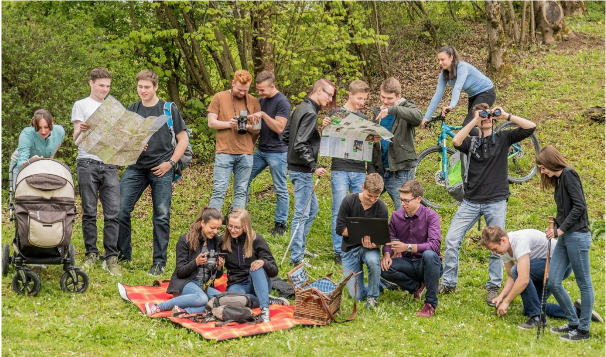
Die Seminarteilnehmer mit Kursleiterin (links), Aufnahme: Foto-Studio Büttner