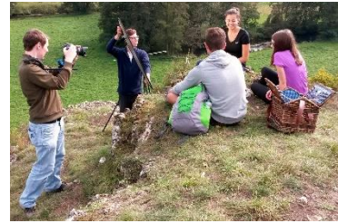
Dreharbeiten zum Werbeclip

Um den Rad- und Wanderführer zu bewerben, wurde in Zusammenarbeit mit Torsten Pajonk von der Agentur one4two in Regensburg ein 40-sekündiger Werbeclip gedreht.