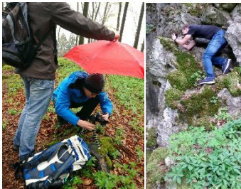
Arbeit des Foto-Teams

In Zweier- oder Dreier-Teams suchten sie in Parsberg und Umgebung sowie ihren Heimatorten nach geeigneten Rad- und Wanderwegen und stellten sie den übrigen Kursteilnehmern vor. Die