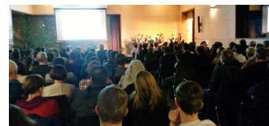
Präsentation im Burgsaal

Nach über einem Jahr mit zahlreichen Höhen und Tiefen konnten die vier Mädchen und elf Jungen dann im Burgsaal Parsberg, der trotz widriger Witterungsverhältnisse bis auf den letzten Platz besetzt war, stolz das Ergebnis ihrer Arbeit präsentieren: einen Rad- und Wanderführer mit 16 ausgewählten Touren rund um Parsberg sowie in Velburg, Hohenfels, Beratzhausen, Laaber und Breitenbrunn, der für alle Altersgruppen etwas zu bieten hat.