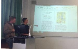
Präsentation erster Layout-Ideen